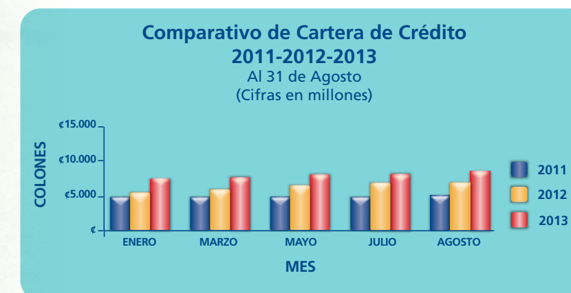
Gráfico No. 5