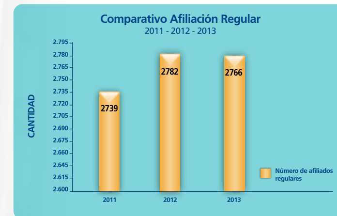
Gráfico No. 1