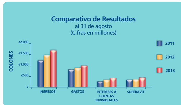
Gráfico No. 4