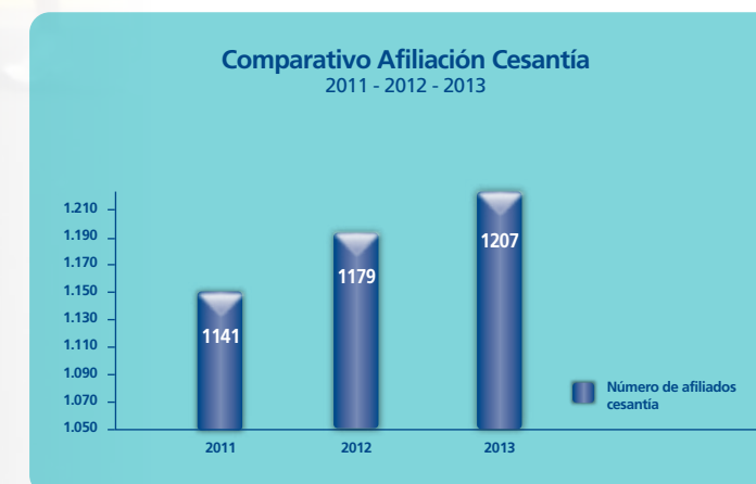
Gráfico No. 2